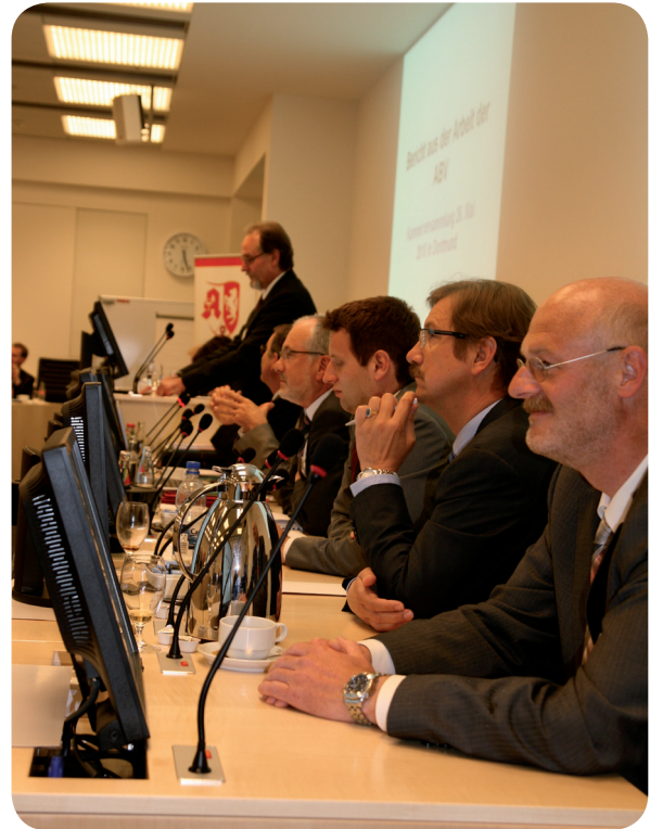
Die Ausschüsse des Versorgungswerkes auf der Kammerversammlung

b) Erhöhung der Rentenanwartschaften zum 1. Januar 2010 für alle dem Versorgungswerk am 31. Dezember 2009 angehörenden Mitglieder, die am 1. Januar 2010 keine Rente beziehen, um den Betrag, der sich ergäbe, wenn für jedes Mitglied 0,5 % seiner bis zum 31. Dezember 2009 an das Versorgungswerk gezahlten Beiträge als einmaliger Beitrag im Jahre 2009 zur zusätzlichen Höherversorgung eingezahlt worden wäre.