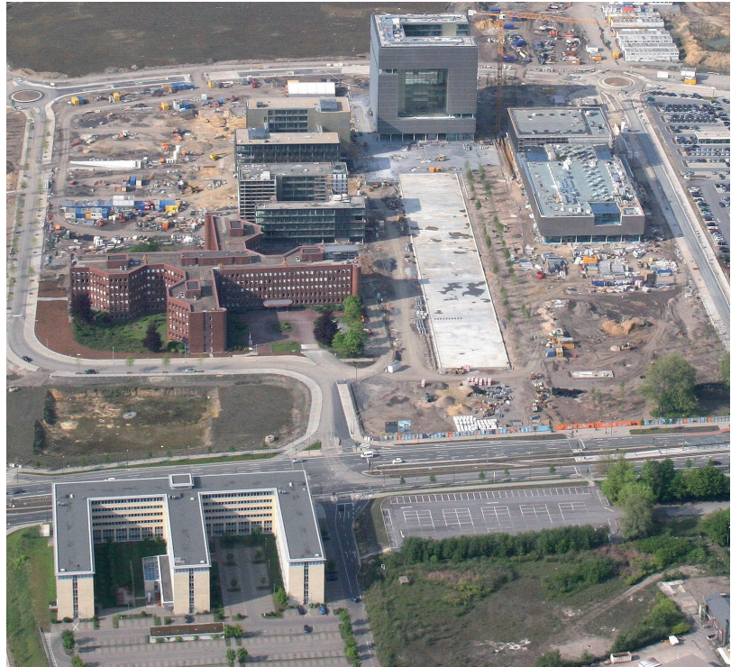
Unten links im Bild: Die bisher größte Immobilie des Versorgungswerkes

Aufgrund der über jeden Zweifel erhabenen Bonität des Mieters investierte der Geschäftsführende Ausschuss fast 30 Millionen Euro in das Projekt. Der Gebäudekomplex wurde inmitten von Brach liegenden industriellen Flächen der Firma Thyssen Krupp errichtet und 2004 bezogen. Schon damals zeichnete sich eine zu-